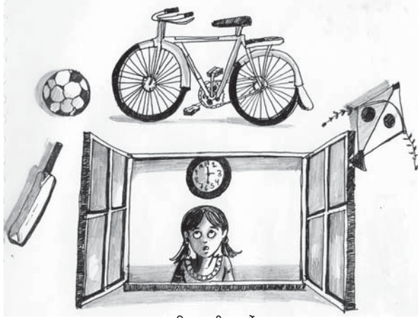
चित्र : हीरा पुर्वे

उपरोक्त लिखित सभी घटनाएँ व उनका अवलोकन विद्यालय में बुने जा रहे अनुभवों का एक दृश्य अंकित करते हैं और ऐसे कई बिन्दुओं को रेखांकित करते हैं जो शिक्षा के अनुभवों को बुनने की प्रक्रिया में चिन्ता की भाँति उभरते हैं और कई प्रश्न छोड़ जाते हैं।