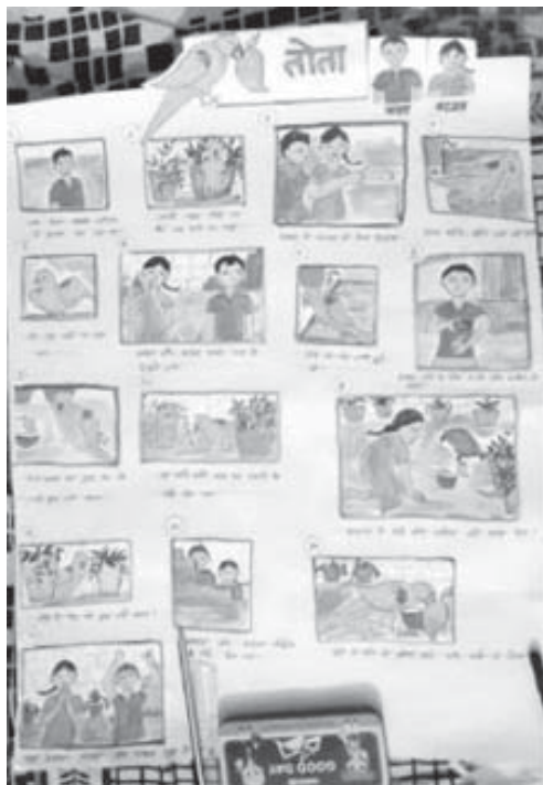
चित्र 2 : एक शिक्षिका के द्वारा बनाया गया पोस्टर

इस पूरे अन्तराल में महिला शिक्षिकाओं की सहभागिता कई मायनों में बेहतर रही। वे न सिर्फ विभिन्न विषयों की चर्चाओं में जुड़ीं बल्कि अपने सवाल, चुनौती एवं अनुभव रखने में पुरुष शिक्षकों से आगे दिखीं (जिन चर्चाओं में मैं शामिल रही उनके, मेरे अवलोकन के अनुसार, अन्य साथियों के अलग अनुभव भी हो सकते हैं)। हम सभी परिचित हैं कि घर में रहने पर महिलाओं की जिम्मेदारी काफ़ी हद तक बढ़ जाती है। इसके अलावा कोविड में ख़ुद की सेहत का ध्यान रखना एक और बड़ी चुनौती है। ऐसा नहीं है कि ये सारी चुनौतियाँ पुरुष शिक्षकों को नहीं रहीं लेकिन महिलाओं की तुलना में शायद कम रही हैं। इसके बावजूद महिला शिक्षकों के विभिन्न विषयों में ख़ुद के क्षमतावर्धन को लेकर किए गए प्रयास अधिक दिखे। पुरुष शिक्षकों की भागीदारी इंग्लिश कोर्स जैसे विषय में अधिक देखने को मिली। कई महिला शिक्षकों को ख़ुद के बच्चों की ऑनलाइन पढ़ाई के लिए अपने मोबाइल से दूर होना पड़ा और अकसर कई चर्चाओं में वे बीच में कई कारणों से डिस्कनेक्ट भी हुईं। एक बार तो एक शिक्षिका ने यह तक कहा कि उनके इंग्लिश कोर्स में जुड़ने से उनके परिवार वालों को दिक्कत हो रही है। वे नहीं चाहते कि उनका समय बच्चों से हटकर कहीं और लगे। ऐसे कारण पुरुष शिक्षकों के साथ कभी नहीं दिखे। तकनीकी रूप से भी कई चुनौतियों का सामना करने के बावजूद महिला शिक्षकों की सहभागिता कार्यपत्रक निर्माण, सहायक सामग्री निर्माण, असाइनमेंट पूरा करने, चर्चा में सक्रिय