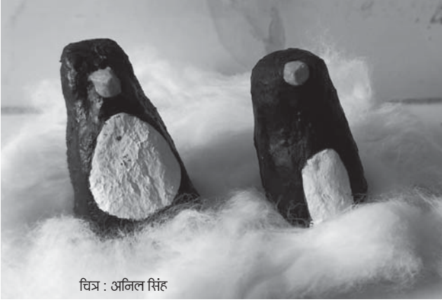
चित्र : अनिल सिंह