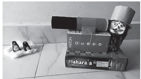
चित्र : अनिल सिंह

उसकी बात में दृढ़ता थी और एक सहज संवेदना भी, कि कहानी ही सही, पर ये शिकारी के खौफ़ वाला हिस्सा क्या डिलीट नहीं किया