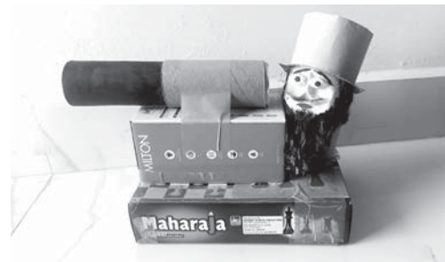
चित्र : अनिल सिंह

‘वक़्त बिताएगा’ का प्रयोग उसने दुनिया में आमतौर पर होने वाले प्रयोग की तरह ही किया लेकिन उसकी प्लेसिंग और भाव को उसने अपनी सहज समझ और निर्विवाद तर्क बुद्धि के साथ किया। कहानी का आनन्द, संकट और चिन्ता का मौलिक भाव और उपाय की रचनात्मकता व तार्किकता, सब कुछ अपने उच्चतम स्तर पर। ये बचकानी बातें तो कतई न थीं। यह कहानी का चमत्कार था। बच्चे बता रहे थे, क्योंकि कोई उन्हें सुन रहा है, कोई उनसे पूछ रहा है। कहानी के भीतर जाने और उसमें शामिल हो जाने की सम्भावनाएँ बनी हैं। उनके बताए उपाय पर सारी स्थिति टिकी हुई है। उनपर बड़ी ज़िम्मेदारी है कि इस वक़्त वे एक ऐसी बात बोल सकते हैं जो पूरा नज़ारा ही बदल दे। बच्चों के इन तर्कों को विवेचना की किसी भी कसौटी पर खरा ही पाया जाएगा। और कहानी अपना पूरा काम करती हुई दिखाई देती है।