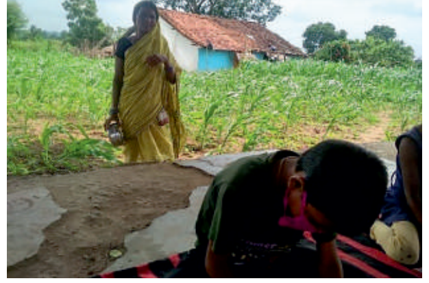
ಶಾಪುರ್, ಬೆತಲ್ ಜಿಲ್ಲೆ, ಮಧ್ಯಪ್ರದೇಶ