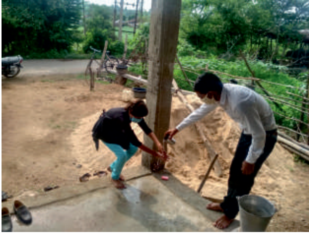
ಶಾಪುರ್, ಬೆತಲ್ ಜಿಲ್ಲೆ, ಮಧ್ಯಪ್ರದೇಶ