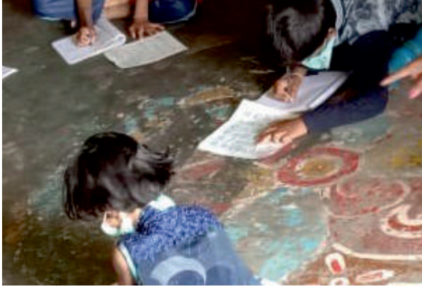
ಸಂಗವೇಡ, ಹೋಶಂಗಾಬಾದ್ ಜಿಲ್ಲೆ, ಮಧ್ಯಪ್ರದೇಶ