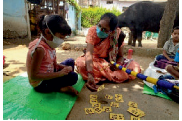
ಖೇಡ್ಲಾ, ಹೋಶಂಗಾಬಾದ್ ಜಿಲ್ಲೆ, ಮಧ್ಯಪ್ರದೇಶ