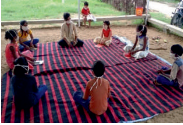
ಶಾಪುರ್, ಬೆತಲ್ ಜಿಲ್ಲೆ, ಮಧ್ಯಪ್ರದೇಶ