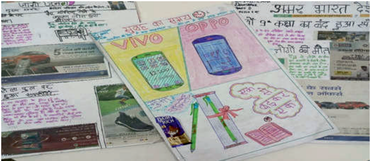
ತರಗತಿಗಳು ಸಿದ್ಧಪಡಿಸಿದ ಪತ್ರಿಕೆಗಳು

ಮೇಲಿನ ಉದಾಹರಣೆಗಳಲ್ಲಿ ಗಮನಿಸಿದಂತೆ, ಪ್ರಜಾಪ್ರಭುತ್ವ ಎಂಬ ಪರಿಕಲ್ಪನೆಯನ್ನು ಪ್ರಾಯೋಗಿಕವಾಗಿಯೇ ಬದುಕಿ ನೋಡ-