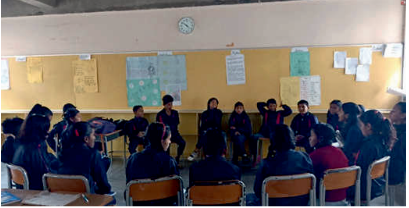
ವಿವಿಧ ಸುದ್ದಿಗಳ ಬಗ್ಗೆ ಚರ್ಚೆ

ನಿರಂತರವಾಗಿ ನೆರವಾಗುವುದರಿಂದ ಪುಸ್ತಕದಲ್ಲಿ ನೀಡಲಾಗಿರುವ ವಿವರಗಳನ್ನು ತಿಳಿದುಕೊಳ್ಳುವುದೂ ಅವರಿಗೆ ಸುಲಭವಾಗಿದೆ ಹಾಗೂ ಪುಸ್ತಕದಲ್ಲಿನ ಸನ್ನಿವೇಶಗಳನ್ನು ವಾಸ್ತವದ ಸನ್ನಿವೇಶಗಳಿಗೆ ವಿಸ್ತರಿಸುವುದೂ ಅವರಿಗೆ ಸಾಧ್ಯವಾಗಿದೆ. ಅದು, ತಾವೇನು ಕಲಿಯುತ್ತಿದ್ದೇವೆ ಎಂದು ಯೋಚಿಸಿ ಮತ್ತು ಶಾಲೆಯಿಂದಾಚೆಗಿನ ತಮ್ಮ ಜೀವನದಲ್ಲಿ ಅದನ್ನು ಅಳವಡಿಸಿಕೊಳ್ಳಲೂ ಸಾಧ್ಯವಾಗಿದೆ.